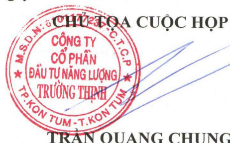
TRẦN QUANG CHUNG